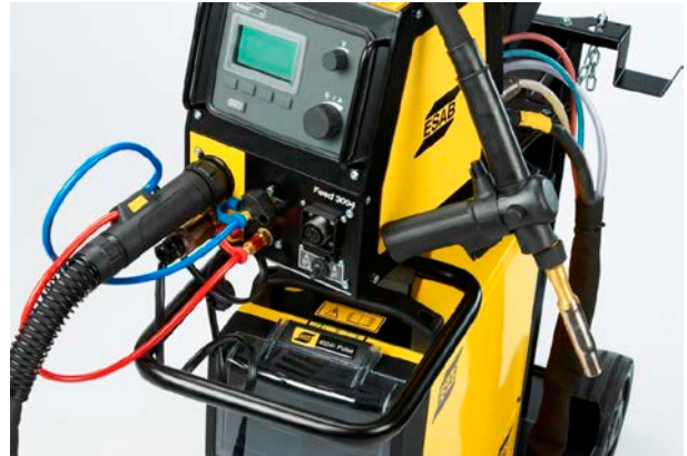
Aristo® Feed 3004 U6 en MXH 400w PP

SuperPulse™ (U8 2 ) verschillende boogtypes met elkaar combineren en tegelijk in te stellen, puls lassen in combinatie met kortsluitboog of sproeibooglassen, of puls puls onder een andere frequentie. Zo zijn de lassnelheid, de warmte inbreng, de inbranding en de neersmelt perfect in evenwicht.