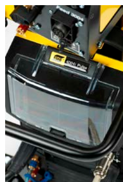
Compartiment voor slijtstukken